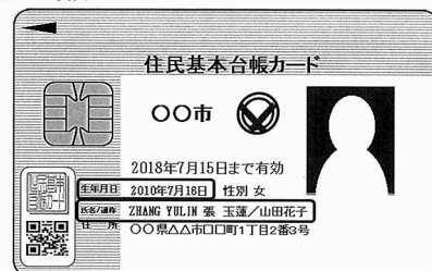
【図 1】住基カード表面